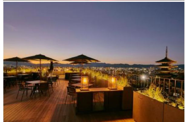
上から「ベージュ アラン・デュカス 東京」内観 シャネルのアイコンであるカメラが描かれた エレガントなデザート「カレ・シャネル」 五重塔を望む「ブノワ 京都」 ルーフトップ Bar「K36(ケーサーティーシックス)」