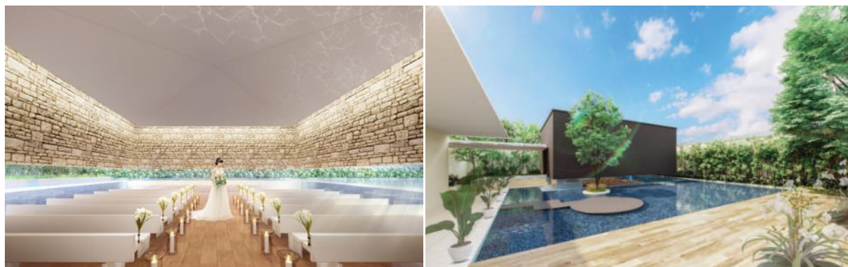
左) 周囲三面の壁に滝を配置し、水に包まれたようなチャペル。「水の国・熊本」がコンセプト 右) 水辺をイメージした庭。お色直しの後、水に浮かぶように作られたステージから新郎新婦が登場するサプライズ入場が可能。デザートビュッフェの会場としてもオススメ

披露宴会場(バンケットルーム)は、高さ約3.5メートル、幅約17メートルの大きな窓から自然光が降り注ぐ、採光性の高い造りです。内装は、木目調の優しい雰囲気と、落ち着いた色合いの深いブルーのじゅうたんやアンティーク調のモダンなシャンデリアなどで、優雅な空間を演出します。屋外には水辺をイメージした、庭を設けます。水に浮かぶようにステージをつくり、新郎新婦のサプライズ入場の演出等に使います。