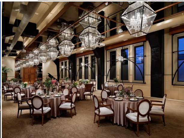
右上)旧桜宮公会堂(大阪) 下左)姫路モリス(姫路) 下右)芦屋モリス(芦屋)