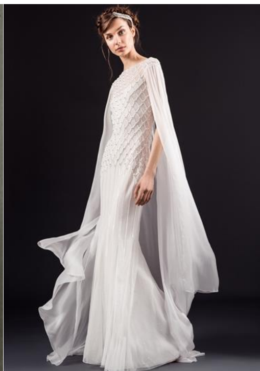
テンパリー・ロンドン …風を受けて広がる軽やかなマントが上品な一着。トップスの印象的なビーズ刺繍でよりロマンチックなルックに