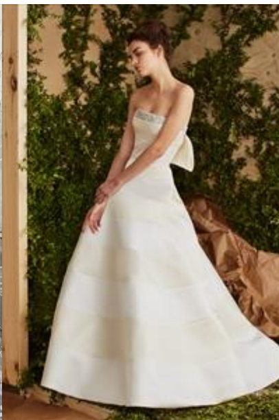
キャロリーナ・ヘレラ …特徴は厚みのあるホワイト系2色のミカドシルクを交互に縫製したデザイン。バックにはリボンを配したリッチな一着