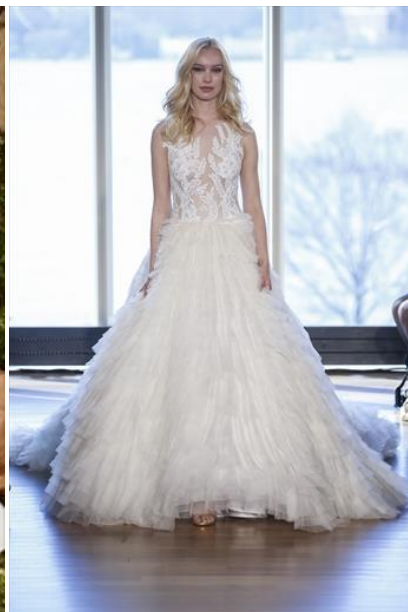
リヴィニ …レースを使用したイリュージョンネックラインのトップにシルクオーガンジーをふんだんに使用したボリュームのあるスカートが特徴