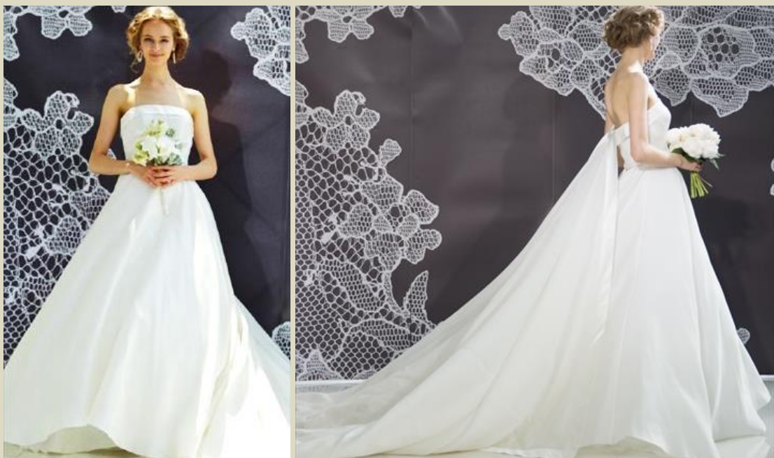
トレーンの取り外しが可能。“後ろ美人”に変身する美しいドレス

スマホのカメラで参列者皆から気軽に撮影される昨今、チャペルでの挙式など背中が見えるシーンの多い結婚式では、新婦のバックスタイルもシャッターチャンスになります。実際、後ろ姿を綺麗に魅せたいファッション感度の高い新婦は多く、新作オリジナルドレスでは、“後ろ美人”で“背中が華麗に変身する”ドレスが目白押しです。ドレスの後ろに取り外し(着脱)できる大きく長いマントやスカートなどを用意し、一つのドレスで後ろ姿に変化を持たせることが可能です。同じく着脱できるレース素材のボレロもあり、羽織るだけで背中が美しく変身します。自由度の高いドレスは、20代後半以降の“こだわる大人”に特に人気です。