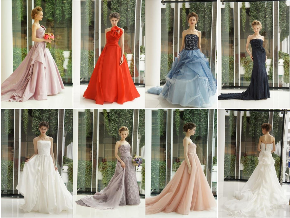
上 左から7~10、下 左から 11~14