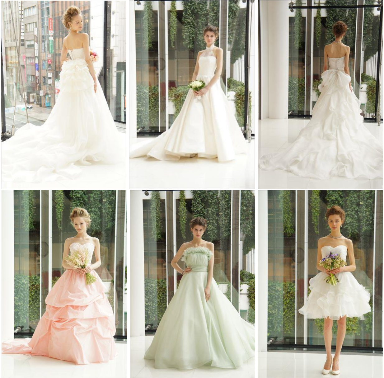
上 左から1~3、下 左から4~6