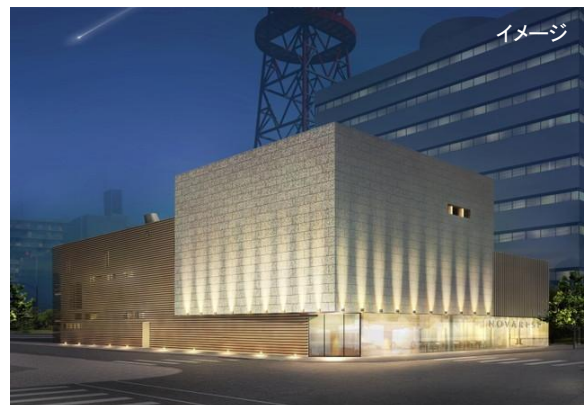
“大人のカップル”をターゲットに、シンプルモダンでスタイリッシュな外観

20代後半から30代の「こだわり婚」を求める新郎新婦をメインターゲットに、婚礼平均客単価は約350万円を目指します。