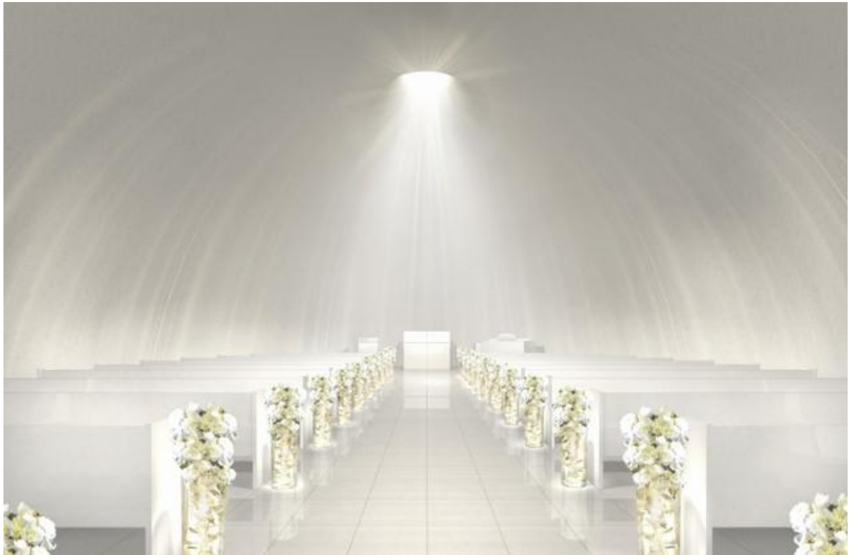
祭壇の真上を天窗にした、自然光が新郎新婦にふり注ぐ半球体のチャペル