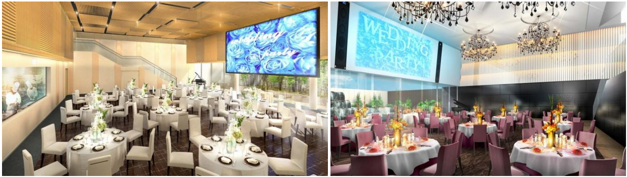
大型スクリーンや大階段、オープンキッチンなどを配備した二つの披露宴会場