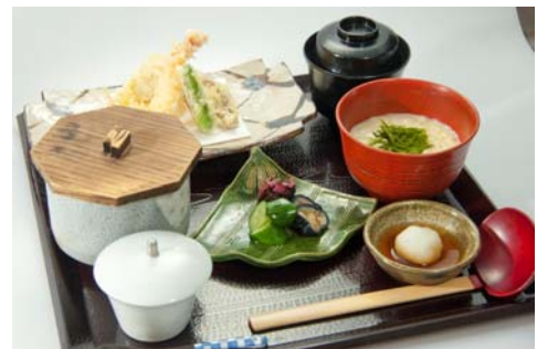
ランチ提供メニュー

また「SHARI」と「まるごと高知」で共通のスタンプラリーを用意し、両店で飲食や物販購入をした方に“ユズカクテル”や高知の名産品を無料提供する特典も用意します。