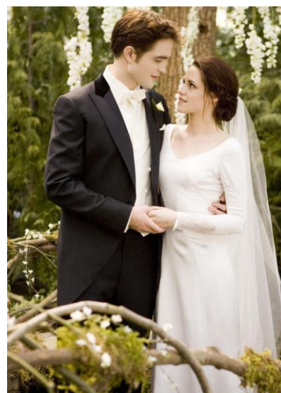
映画「トワイライト」から

これまでイタリア・ブランドを展開してきた当社にとって、ニューヨーク・ブランドを大々的に入荷するのは初めてです。NY セレブやハリウッドスターが愛するブランドで、記念すべき披露宴をより華やかに演出します。