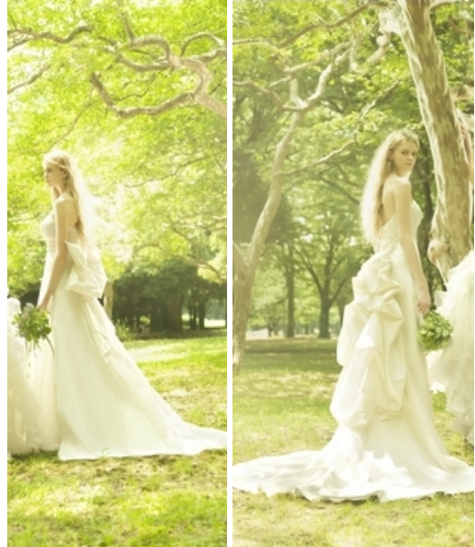
左)リボン取り外し可能 右)トレーン付け替え可能