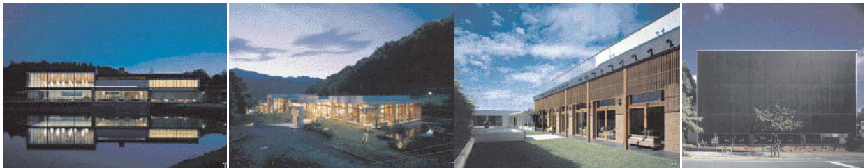
全施設が異なるデザイン