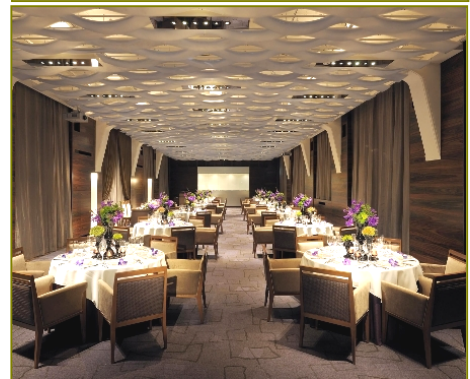
上) 重厚なクラシカルな外観 下) 近代的な内装デザイン