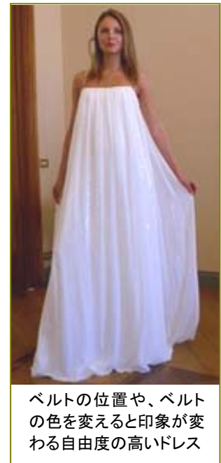
ベルトの位置や、ベルトの色を変えると印象が変わる自由度の高いドレス

ベルトの位置や色を変えることで異なるイメージになるドレスなど、新婦の好みで自由にアレンジできる今までにない斬新なデザインを揃えます。