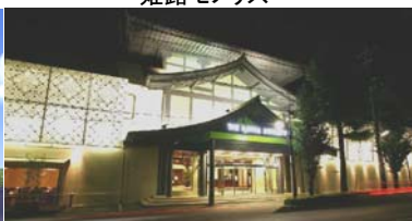
ザ ロイヤル ダイナスティ

左)「三瀧荘」広島市の昭和初期・和洋折衷の歴史的建造物をゲストハウスとして再生(10/16オープン)