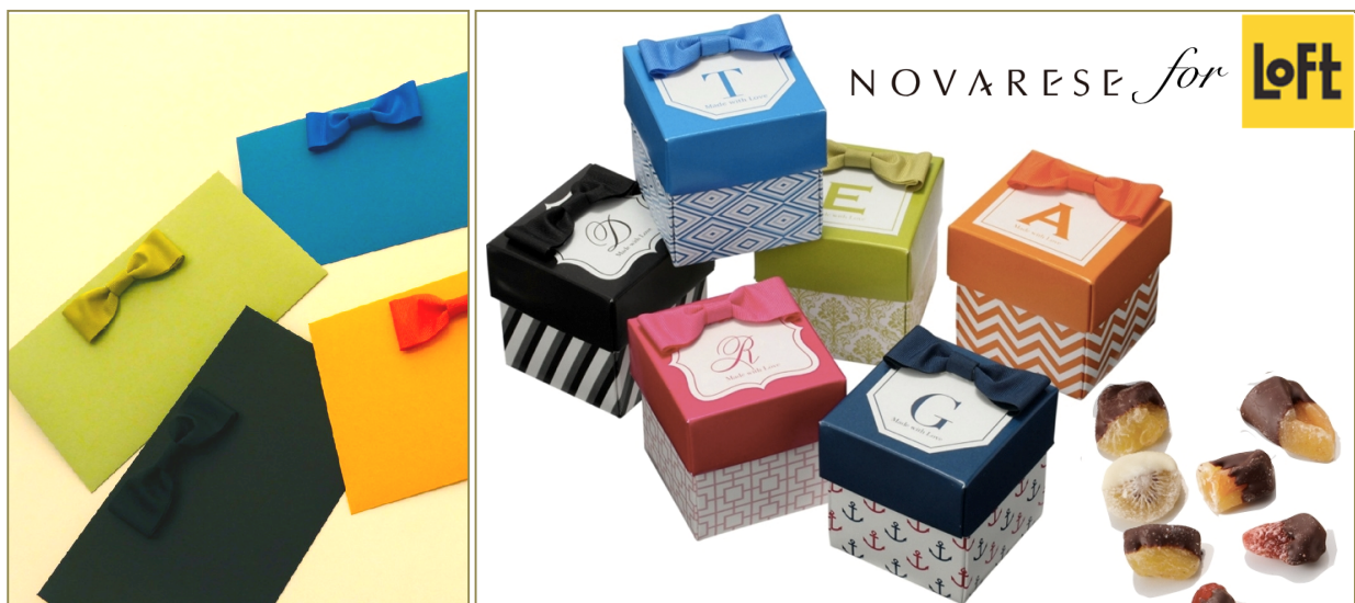
左)コンパーテス店舗未発売のチョコレートサブレを入れる「チョコレートサブレ」 右)ドライフルーツをディップした4種のチョコを詰め合わせる宝石箱型の「Made with Love」

ウエディングプロデュース・レストラン運営の株ノバレーゼ(本社:東京都中央区、浅田剛治社長、東証一部、資本金:6億円)は、生活雑貨のロフトと共同で“女子チョコ”にも可愛いバレンタイン商品を開発、2012年1月20日(金)(予定)から全国のロフト22店舗で発売します。